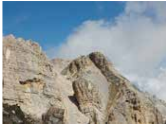
Vista sulle Torri del Lätëmar