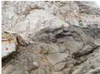
Le bianche rocce calcaree del Lätëmar sono frequentemente intercalate a filoni di scure rocce vulcaniche basaltiche

Il Gruppo del Lätëmar è racchiuso tra il Passo di Costalunga a nord, la Val di Fassa a nord est, la Val di Fiemme a est e a meridione e il Passo di Lavazè a ovest. La sua estensione è piuttosto ridotta e la morfologia risulta asimmetrica, con pareti verticali e campanili che incombono sul Passo di Costalunga e pendii molto più morbidi sui versanti trentini. La forma è quella di un ferro di cavallo aperto verso oriente e completamente circondato da fitti boschi, soprattutto sui versanti della Val di Fiemme e del Passo di Costalunga. Il nome della montagna è attestato già nel 1100 come Laitemâr e deriva da un maso omonimo. La classificazione SOIUSA considera quattro sottogruppi: la Cresta del Lätëmar, il Sottogruppo di Valsorda, le Propaggini Meridionali e l'Altopiano di Nova Ponente. Gli ultimi due, con caratteristiche di quote minori, non rientrano nelle aree considerate in questa guida.