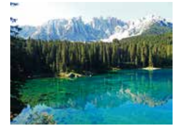
La surreale cartolina del Lätëmar che si specchia sul Lago di Carezza

Si racconta che nel Lago di Carezza si vedano riflessi tutti i colori dell'iride. La leggenda narra che lo stregone del Lätëmar si fosse innamorato di Ondina, la ninfa che abitava il lago e tentò di ra-