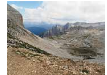
La "lunare" Valsorda