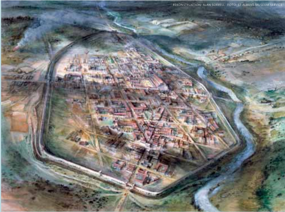
Ansicht des municipium Verulamium am Fluss Ver im 2. Jahrhundert.

St Albans – eine Stadt in Europa zu sehen. Sie belegt, wie sehr England immer auch im europäischen Kontext zu sehen war. Die politischen und kulturellen Bindungen zum Festland waren nämlich nicht bloß verlockend, sondern auch die Folge handfester wirtschaftlicher Zwänge. Jede der acht Ausstellungstafeln stellt eine andere Epoche vor und zeigt, wie eng England und insbesondere St Albans mit der europäischen Geschichte verwoben ist. Vier Jahrhunderte lang bestimmte Rom die Geschehnisse Englands und machte St Albans – genauer: Verulamium – zum municipium , zu einer der drei wichtigsten Städte Britanniens. Die römischen Legionen am Rhein deckten ihren Bedarf an Getreide und Vieh aus der Gegend um Verulamium. Noch heute kann man in St Albans eines der wenigen in England errichteten römischen Theater bewundern. Auch Zeugnisse