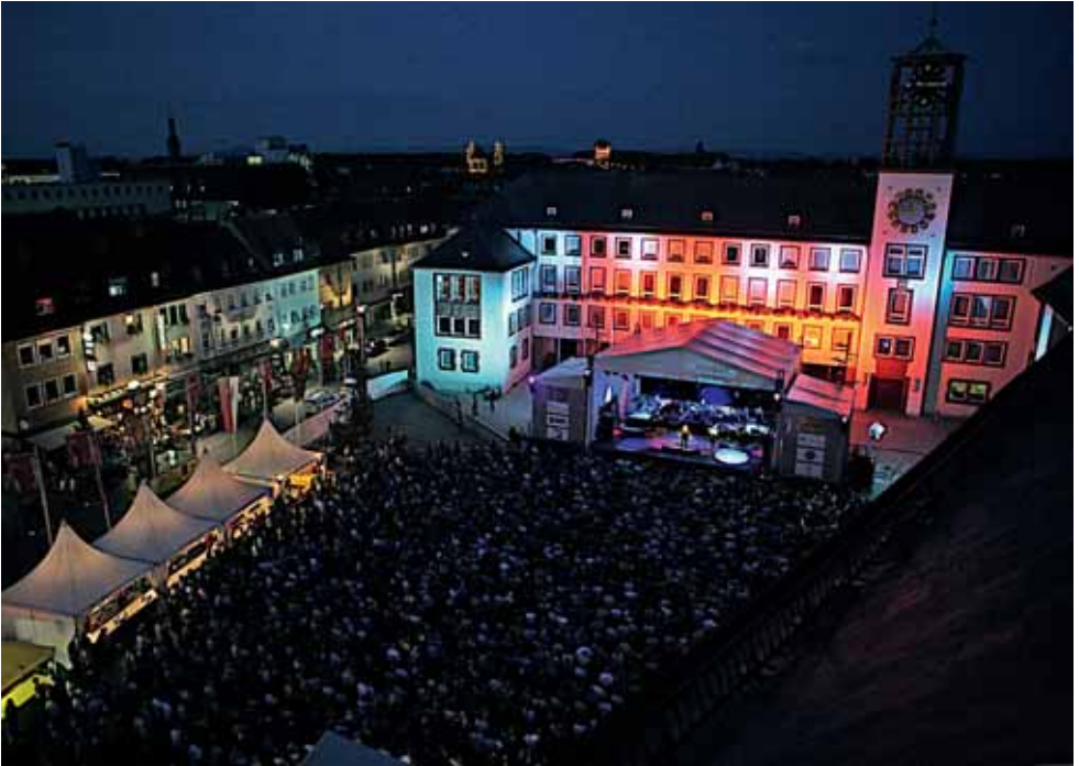
Joe Cocker bei »Jazz & Joy« auf dem Marktplatz.