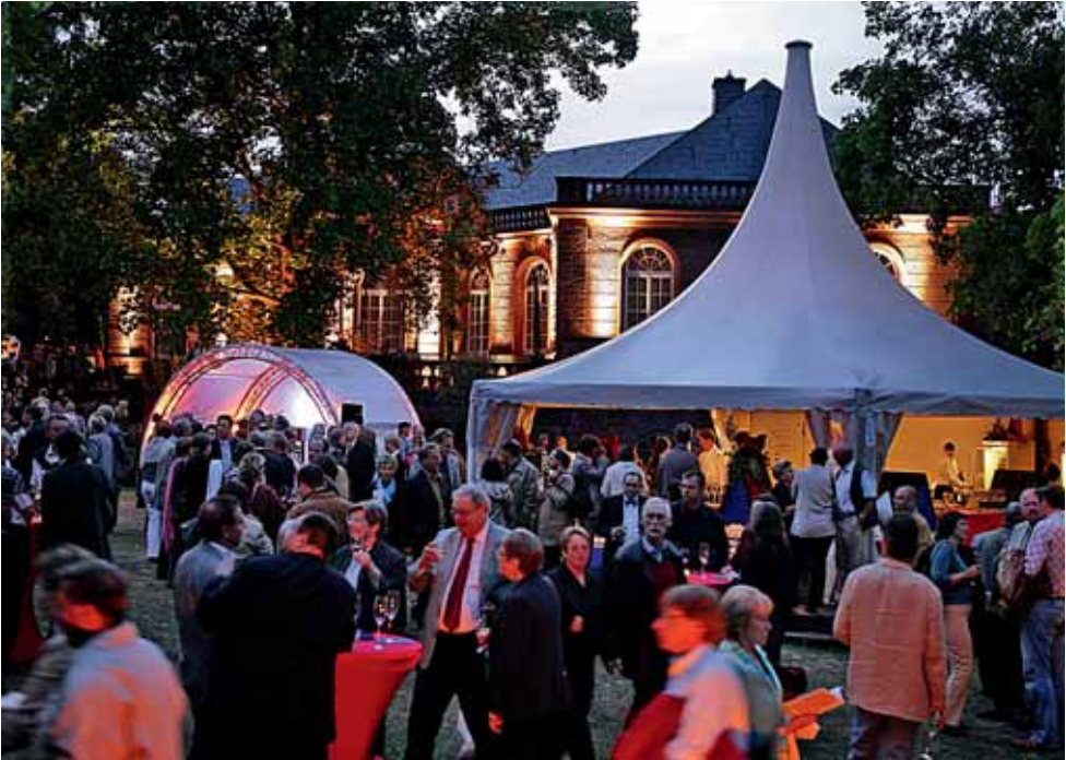
Heylshofgarten als stimmungsvolles »Foyer« der Nibelungenfestspiele.