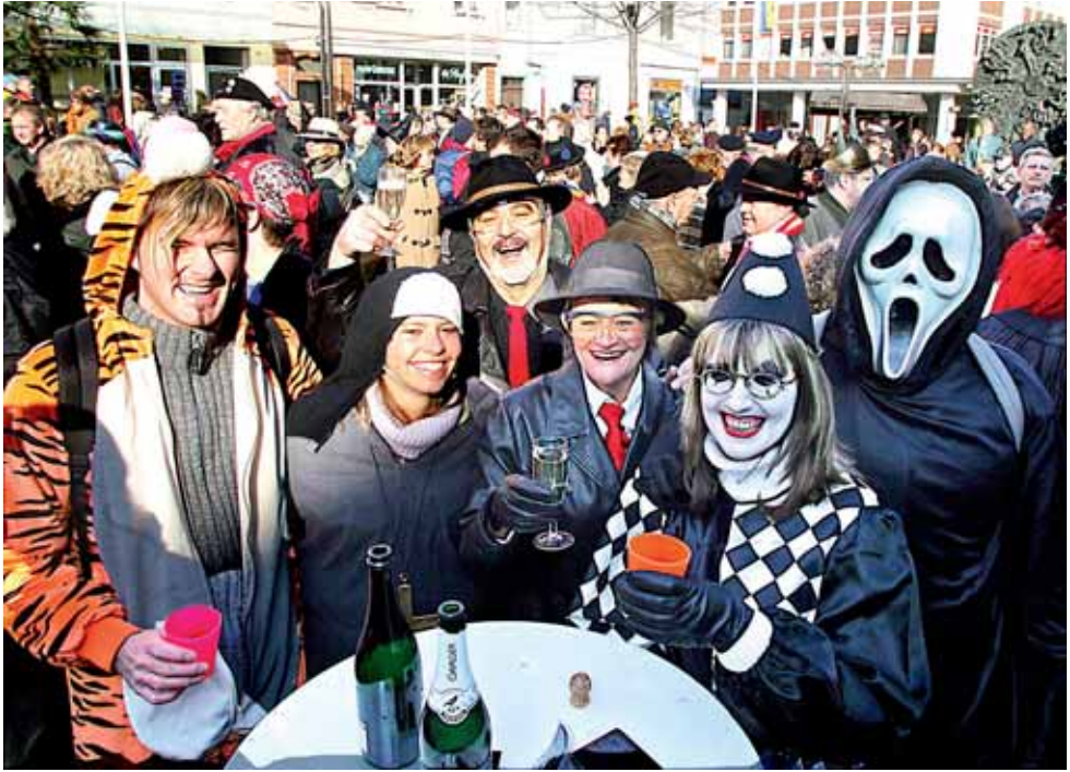
Obermarkt, »Spass uff de Gass«.