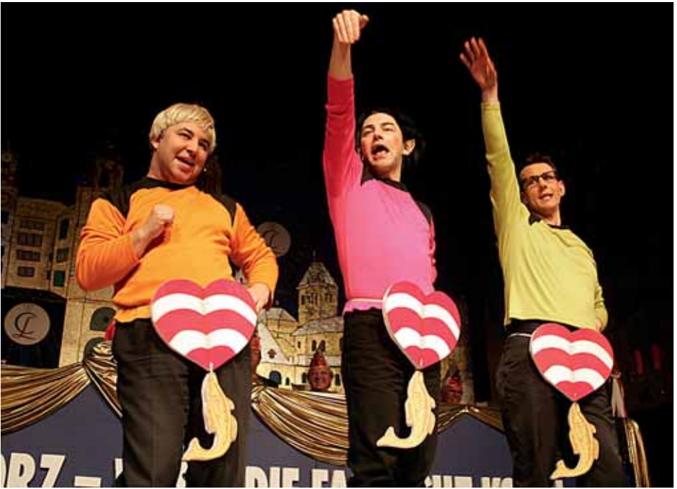
Fastnachtssitzung beim »Liederkranz«.