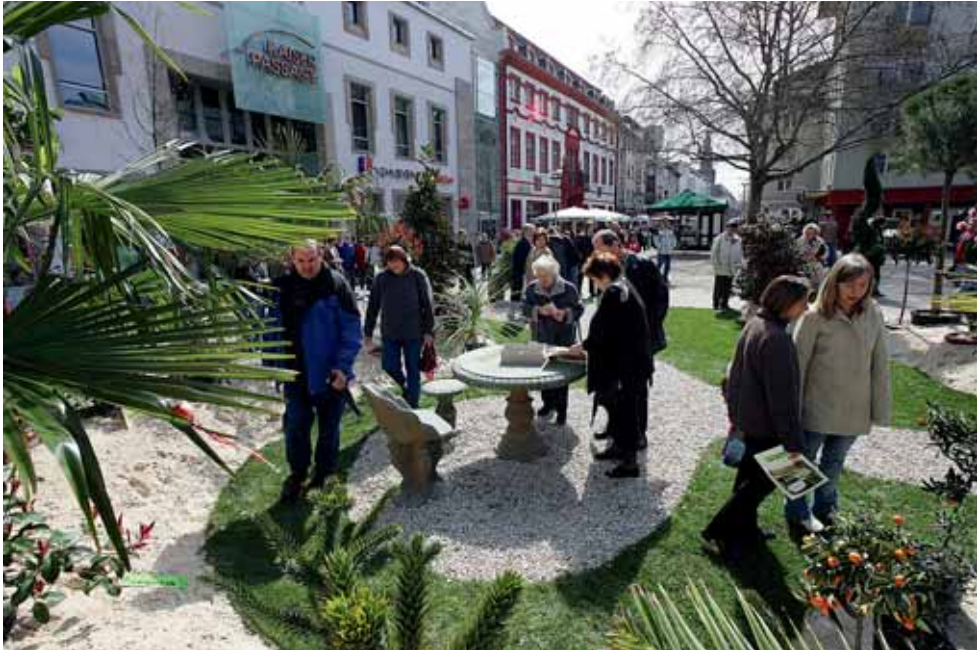
Ludwigsplatz, »Worms blüht auf«.