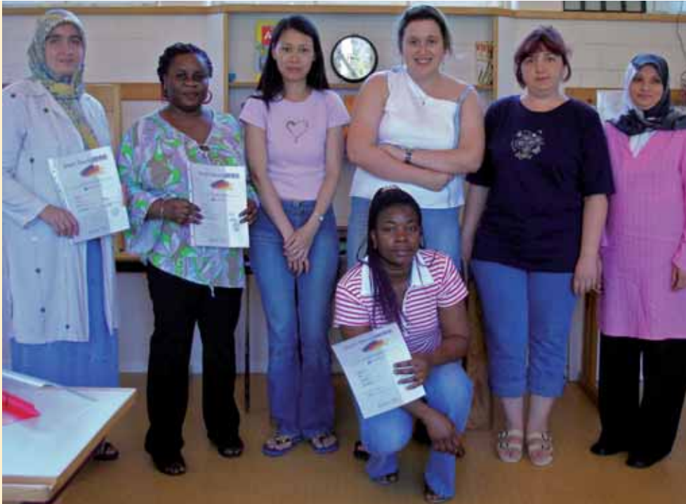
Stolz präsentieren Teilnehmerinnen des Deutsch-Sprachkurses ihre VHS-Diplome.

Ausländische Frauen stehen oft vor Problemen, die sich Deutsche nicht vorstellen können, wie z.B. »Wie fahre ich mit dem Zug in eine andere Stadt?«, »Was brauche ich, wenn ich zum Arzt gehen will?« – von deutschen Formularen ganz zu schweigen. Solche Fragen wurden praktisch angegangen. Wir ha-