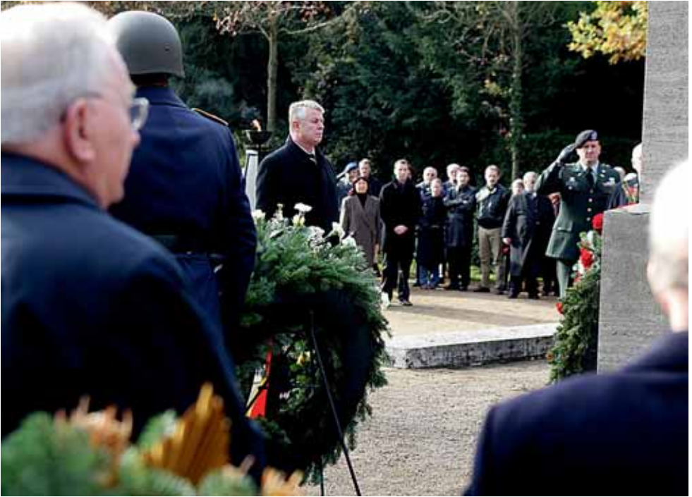
Friedhof Hochheimer Höhe, Volkstrauertag.