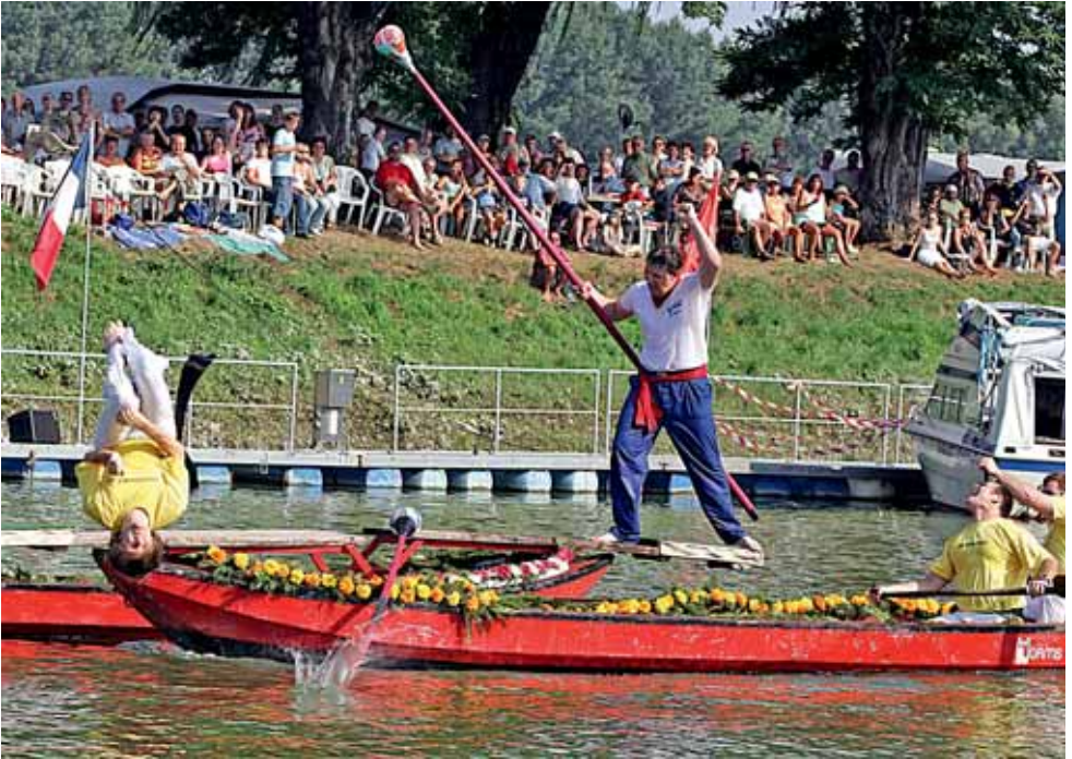
Fischerstechen im Floßhafen.