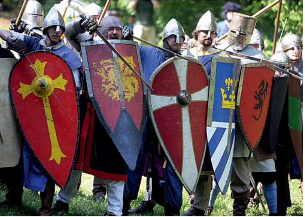
Spectaculum im Wäldchen.