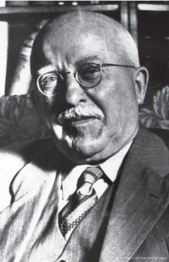
Hermann Staudinger (1881–1965).

er am Institut des Chemieprofessors Jakob Volhard. Hier wurde Staudingers wahres Interesse geweckt. Immer mehr beschäftigte er sich nun mit dem Studium der Chemie und legte im Jahr 1900 sein erstes Verbandsexamen als